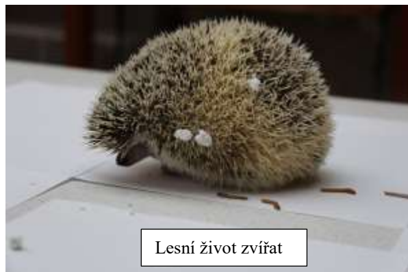
Lesní život zvířat

Když byl dostatečný zájem, tak většinu pátek probíhaly akce jako doplňkový program k adopčnímu klubu. Zde se vyrábělo, tvořilo nebo se hrály deskové hry a povídalo se o různých přírodovědných tématech. Jelikož se v předchozím roce osvědčilo posunout začátek akce již na 13:00, tak bylo rozhodnuto tento čas ponechat i nadále.