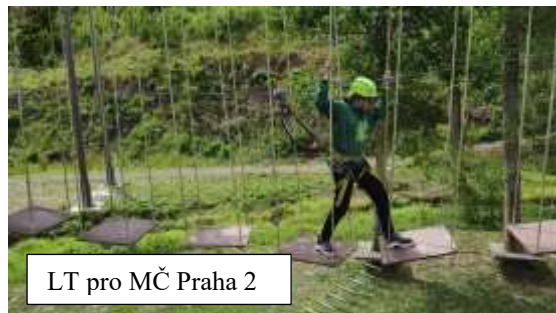
LT pro MČ Praha 2

Pololetní zimní tábor – protože se koná mimo jarní prázdniny na Praze 2, je stále nižší počet účastníků a je velice problematický z hlediska financování. Účastníci jsou ale vždy maximálně spokojeni. Přes den se lyžovalo, večer probíhaly technické činnosti (programování, elektro, modelářství). Je třeba ale do budoucna zvážit, zda i na dále tento tábor pořádat, (pokud se nezvýší počet účastníků). Jinak všechny pobytové tábory proběhly v pořádku a od dětí i rodičů přišly jen kladné odezvy.