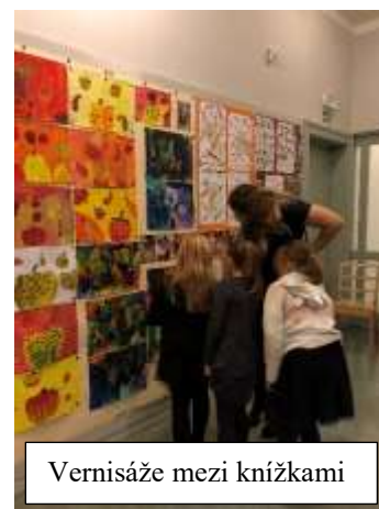
Vernisáže mezi knížkami

Úspěchy zaznamenaly i děti z výtvarných kroužků v soutěžích pořádaných jinými organizacemi: V celorepublikové soutěži Blízko i daleko VDV získala za soutěžní práce Cenu kurátora výstavy, v mezinárodní výtvarné soutěži Lidice nejvyšší ocenění Lidickou růží a tři čestná uznání. V celopražské soutěži Kouzelná zahrádka děti z VDV opět zabodovaly, dvanáct úspěšných výtvarníků napříč výtvarnými kroužky obsadilo vítězná místa.