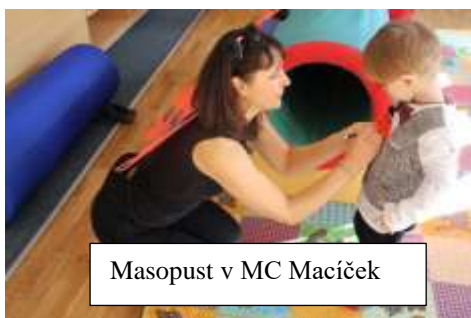
Masopust v MC Macíček

V rámci MC Macíček pak proběhly tradiční předvánoční akce. Mikulášská nadílka a Vánoční besídka