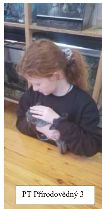
PT Přírodovědný 3

Všichni vedoucí byli lidé se zkušenostmi z táborů a pobytových akcí, takže vše probíhalo bez problémů. Díky Šablonám bylo možná jezdit i na příměstských táborech na více výletů i mimo Prahu, případně si objednat programy od odborníků z praxe, které byly velmi pěkně vedeny a pro děti byly velkým přínosem. Rodiče dětí dávali vedoucím velmi pěknou zpětnou vazbu na organizaci a přípravu tábora.